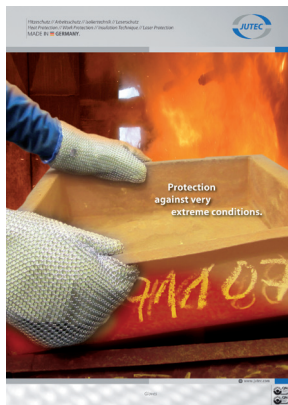
Osobní ochranné pomůcky do vysokých teplot

Vyžádejte si více informací o našich produktech