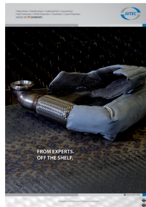
Izolace a tepelná ochrana