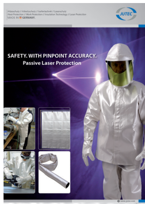
Ochranné pomůcky pro pasivní laserovou ochranu