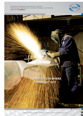
Tepelně ochranné tkaniny a matrace