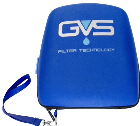
SPM007 Pouzdro pro masku ELIPSE INTEGRA - lze připevnit k opasku