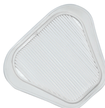
Rámeček a filtr P3 pro masky High Performance