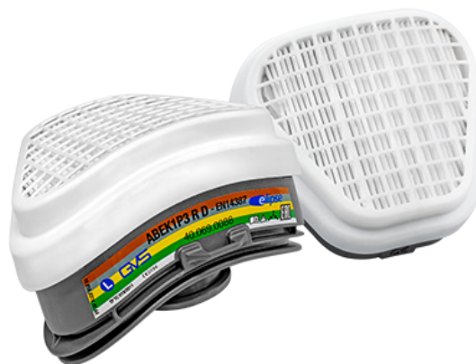
SPR492 Sada filtrů ABEK1 P3 pro polomasku ELIPSE